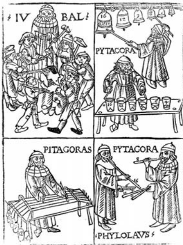
פיתגורס מתואר כראשון שמוצא את הקשר בין מספרים יחסים וצלילים

מקרא: (ע"ע) עיין ערך: שמות תיאורטיקנים המצוטטים באסופה. * (כוכבית): הפניה לביוגרפיות המופיעות בסוף האסופה.