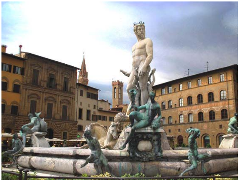
מזרקת נפטון, אמנאטי, הכיכר המרכזית, פירנצה, 1575.