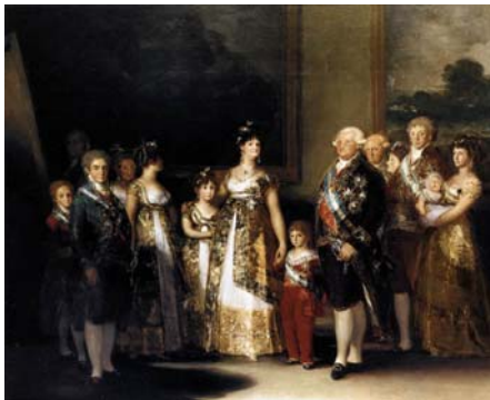
גויא, "שארל ה-IV ומשפחתו", 1800, שמן על בד, 336X280 ס"מ, מוזיאון הפראדו, מדריד.