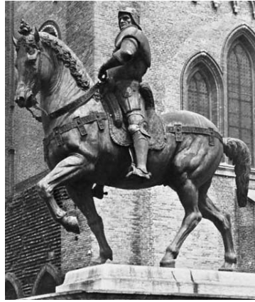
ורוקיו : הפרש : ונציה, 1483-88.