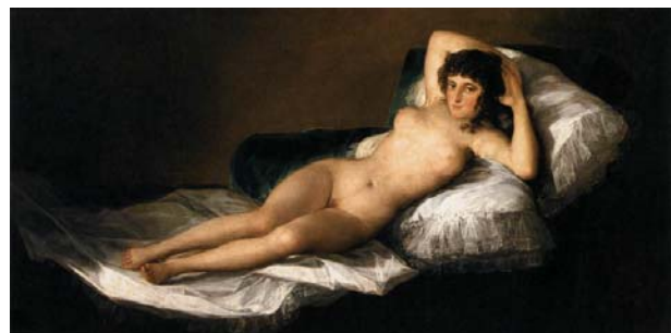
פרנסיסקו גויה, "המחה העירומה", 1799-1800, שמן על בד, 97X190 ס"מ, מוזיאון הפראדו, מדריד.