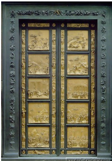
גיברטי, שער בית הטבילה, 1425-52, פירנצה.