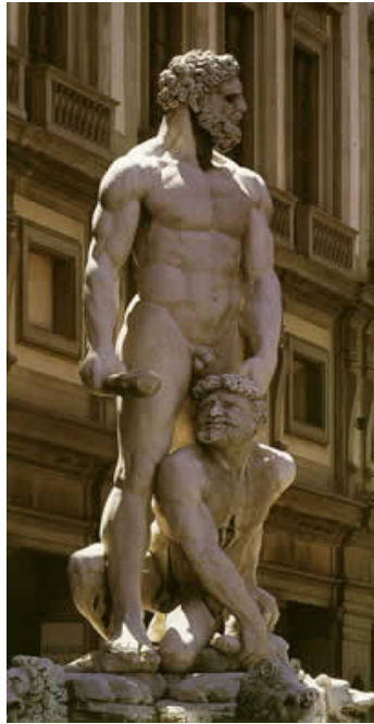
הרקולס וקאקוס, בנדינלי . הכיכר המרכזית, פירנצה 1583 .