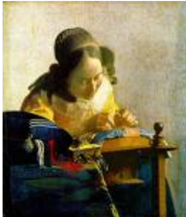
"רוקמת התחרה", רמייר, שמן, 20 x 24, מוזיאון הלובר פאריז.

קיצוני מכל היה יחסי לבנינים, את אלה כלל לא הכרתי ועל כן לא זכרתי אלא כרקע, מעין מסך, שכנגדו מתרחשים חיי היומיום. כך ב-פאריז ולאורך כל המסע, הן לפני והן אחרי שהחלטתי ללמוד אדריכלות. אבל כמו שאומרים היו "יוצאים מן הכלל המעידים על הכללי". כך למשל, בשני הבניינים של ז'אק-אנג' גבריאל בכיכר "קונקורד" בפאריז, שבזכותם פניתי לתחום האדריכלות. לאלו אפשר לצרף עוד שורה לא קטנה של בנינים מוכרים וזכורים ולא רק לי אלא לכל תייר ומבקר ב-אירופה: מגדל אייפל, ב-פאריז, ארמון הדוגים ב-וונציה וכנסיית ס' פטר ב-רומא, ועוד אי אלו ברחבי העולם שהכרתי מגלויות וצילומים בלבד, כגון הפירמידות ב-מצרים הטאג' מאהל ב-הודו, ההגיייה סופיה ב-איסטנבול או הקרמלין ב-מוסקבה ואפילו כמה בארץ שהופיעו על בולי דואר מתקופת המנדט הבריטי: כיפת הסלע, בירושלים ומגדל דוד. אבל ספק אם ידעתי את משמעות ההבדל בינם לבין בנין קבר רחל שליד בית לחם, שגם הוא הופיע על גבי אחד הבולים.