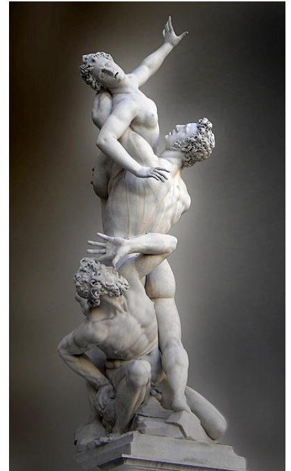
"הסבינות", ג'אן בולוניה