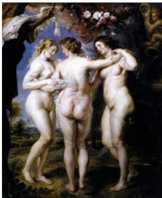
רובנס, "שלושת הגרציות", 1639, שמן על עץ, 221X181, מוזיאון הפראדו, מדריד.