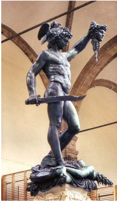
פרסאוס עם ראש המדוזה, בנבניטו ציליני, לודגיה דה לאנסי, 320 ס"מ, 1545-54, פירנצה.