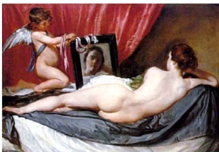
דיאגו ולסקו, "ונוס מול מראה", 1649-51, שמן על בד, 122.5X177, הגלריה הלאומית, לונדון.