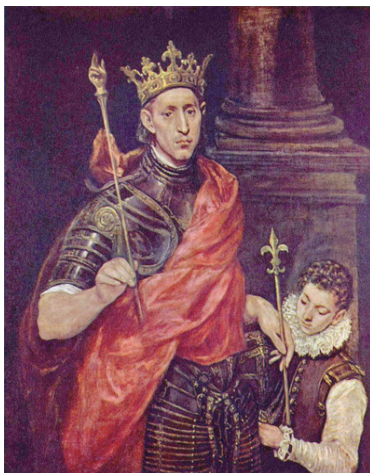
אל גרקו: מלך צרפת, מוזיאון הלובר 95 cm x 1171587-97.