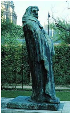
אוגוסט רודן: "דיוקן באלוק. עטוף בחלוק" 1939 יציקת וחושב

במבט לאחור מפתיע עד כמה מועט המטען שנוסף לאותן "שלוש מזוודות הרוח" שנשאתי עימי כאשר יצאתי לאירופה. במיוחד נכון הדבר בתחום החזותי, כי דווקא בו השתדלתי שלא להחמיץ דבר "לספוג הכול ורק אחר כך למיין", כפי ששמעתי את אבא אומר לאמנים הצעירים שהתייעצו איתו לפני שיצאו למסע הלימודים בפאריז. אולם מסתבר שהמציאות אשר חוויתי – לפחות זו שנתרה בזיכרוני – הייתה שונה מאוד: את אשר הכרתי זכרתי ואילו השאר נמוג כערפלי הבוקר לאחר זריחת החמה. כך גם ביחס לציורים ועוד יותר לפסלים שמהם "הכרתי-וזכרתי" רק בודדים, כגון "ונוס ממילוס" ו"ניקה מסמוטרכיה" מהעת העתיקה. שניהם בכניסה למוזיאון ה"לובר" או "בלזאק" של אוגוסט רודן הניצב בפאריז, בשדרות ראספאי (Raspail). אמנם הכרתי עוד כמה מעבודותיו של רודן, ביניהם היותר מפורסם "האיש החושב", אבל לא ראיתי אותן כי משום מה לא ביקרתי במוזיאון של יצירותיו אלא כעבור עשרות שנים. אותו הדין ואף קיצוני יותר היה יחסי למיכאלאנג'לו: איני זוכר שראיתי אף אחד מפסליו למעט "דוד" בפירנצה – תופעה תמוהה למדי כי למעשה גם את עבודותיו הכרתי מספרים שהיו בבית. יתרה מכך שמעתי לא פעם את הדעה שהשניים, כלומר רודן ומיכאלאנג'לו, הם משכמם ומעלה מכל שאר הפסלים והיחידים הראויים לתשומת לב.