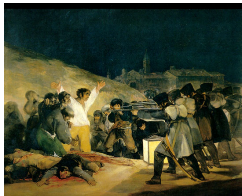
ההוצאה להורג ה-3 במאי 1808, גויא, שמן על בד, 1814, 266 X345, מוזיאון פראדו, מדריד.