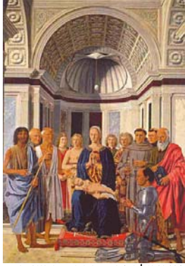
פיירו דלה פרנציסקה, "המדונה", 170X248 ס"מ, 1473, גלריה ברירה, מילאנו.