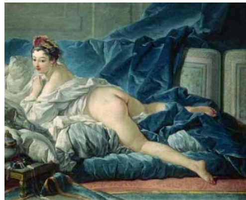
פרנסואה בוש, "האודליסק החומה", 1745, שמן על בד, 53X64 ס"מ, מוזיאון הלובר, פאריז.