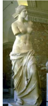
ונוס ממילוס, שיש, 2.04 מ', 100 לפנה"ס, מוזיאון הלובר.