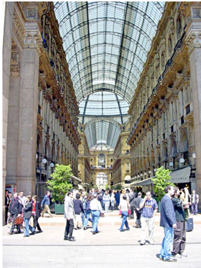
הגלריה ויקטור עמנואל מילאנו.