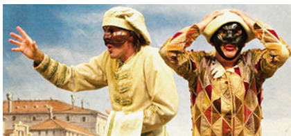
קרלו גולדוני, משרתם של שני אדונים בסגנון "הקומדיה דל ארטה", 1753.

Antonio Vivaldi 1678-1741 Carlo Goldoni 1707-1793