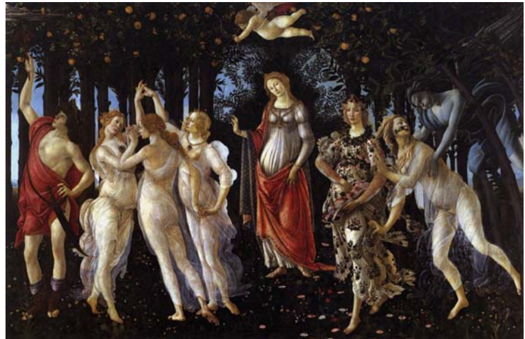
סאנדרו בוטיצ'לי, "פרימאורה", 1482, טמפרה על פאנל, 314X203 ס"מ, גלריית אופיצי, פירנצה.