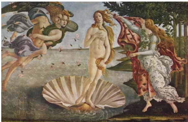
סאנדרו בוטיצ'לי, "לידת ונוס", סביב 1485, טמפרה על בד, 172.5X278.5 ס"מ, גלריית אופיצ'י, פירנצה.