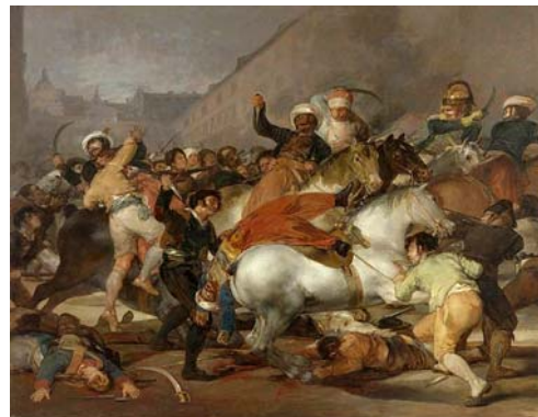
הסתערות הממלוקים על מגיני מדריד ה-2 במאי 1808, גויא, 1814, 245 X266, שמן על בד, מוזיאון פראדו, מדריד.