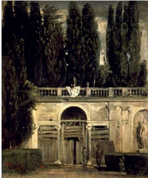
וילה מדיצ'י בגני וילה בורגזה, שמן על בד, דייגו ולאסקז, 43X48 ס"מ, 1630, בפראדו.

מהמסע בספרד ידוע לי כיום על עוד עשרות תמונות באוסף ה"פראדו" שמשום מה לא הוצגו, ביניהן "וילה בורגזה" של ולאסקז, ואמנים אחרים, כגון זורבראן ריברה ומוריו, שהעדרן אינו מובן כלל. פחות מפתיע הן התמונות של גויא החל מהערום – נושא שכבר דנתי בו אין צורך לחזור עליו עבור דרך תמונות המרד "השני למאי 1808", כנגד הכיבוש הצרפתי בימי נפוליון או "השלישי למאי 1808" המציג את ההוצאה להורג של המורדים. אני מניח שאלו, כלומר המרד וההוצאה להורג, נראו "מסוכנות" מדי בעיני פרנקו ואנשיו, ששלטונם נשען, כמו בימי נפוליון, על הצבא והמשטרה. לעניין זה גיליתי גם קירבה מסוימת שבדאי היא זו שגרמה לסילוק תמונת המרד למרות היותה נושא כה "פטריוטי": החיילים המותקפים במרד נראים לבושים בבגדים מזרחיים. מסתבר שהיו אלה מתנדבים ממלכים שהצטרפו לצבא נפוליון במצרים. קרוב לודאי שמוצאם של חיילים אלה לא נעלם מעיני הספרדים מתנגדיו של פרנקו שהחל את דרכו לשלטון באמצעות הגדודים המרוקאים שהיו פיקודיו הנאמנים ביותר. אני מניח שאותו שיקול גרם להסתיר את תמונת משפחת המלוכה של גויא – תמונה מוזרה שבה המשפחה צוירה "כמות שהיא", וודאי שלא מעודדת לכוונתו של פרנקו להחזיר את ספרד לשלטון מלוכני לאחר מותו, כפי שאכן קרה. אבל בניגוד לציפיות המלך, כידוע, הסתפק במעמד חוקתי.