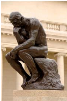
האיש החושב, רודין, 1902, ברונה ושיש, פאריז.