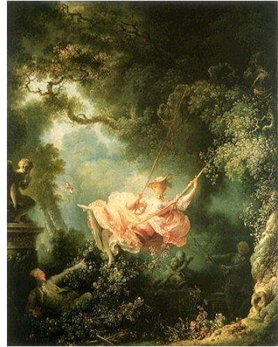
ז'אן הונורה פראגונארד, "הנדנדה", 1767, שמן על בד, 81"64 ס"מ, אוסף וואלס, לונדון.