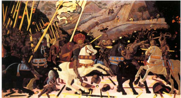
פאולו אוצ'ולי, "קרב סאן רומאנו", 1438-1449, טמפרה ושמן, הגלריה הלאומית, לונדון.