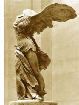
"ניקה מסמוטרכיה", 2.5 מ', שיש, 150-220 לפנה"ס, לובר.

על תופעת "הכרתי-ראיתי" אפשר לומר כי "יש לזיכרון רצון משלו" מעין "עריצות הזיכרון". אפשר גם שההסבר פרוזאי כמו המפגש עם מכר בין זרים, ובכל מקרה, תופעה המשאירה מעט מאוד מקום לכניסתו של הבלתי ידוע. לתופעה זו מצטרפות שתיים נוספות: האחת, כיצד זה שפגשתי כה מעט מעשרות התמונות שכבר הכרתי ואהבתי מספרים ומאלבומים. השניה היא היפוכה: איני זוכר אף תמונה שאהבתי, מאלה שראיתי לראשונה במוזיאונים, אבל לא הכרתי. במילים אחרות התהליך היה תמיד הפוך: קודם ההיכרות עם הרפרודוקציה ורק לאחר מכן המפגש הבלתי אמצעי עם היצירה. אפשר שגרמה לכך התחושה שהקיר הוא "שם" לעומת הרפרודוקציה שהיא כאילו "כאן". עם זאת ולמרות תופעת השיכחה, המסע היה ראוי בזכות המעבר לחומר, לצבע ולממדים אמיתיים שאיפשרו לי בהמשך לדמיין לעצמי, בעיני רוחי, גם יצירות שלא הכרתי.