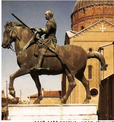
דונאטלו: הפרש : פאדובה 1447-1453 .