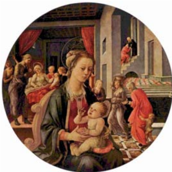
פרה פיליפּו ליפּי, "מריה והילד", סביב 1452, טונדו, קוטר: 135 ס"מ, פירנצה.