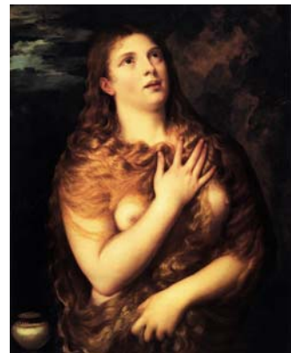
טיציאן, "מריה מגדלנה", סביב 1532, שמן על עץ, 84X63 ס"מ, גלריה פאלאטינה, פלצו פיטי, פירנצה.