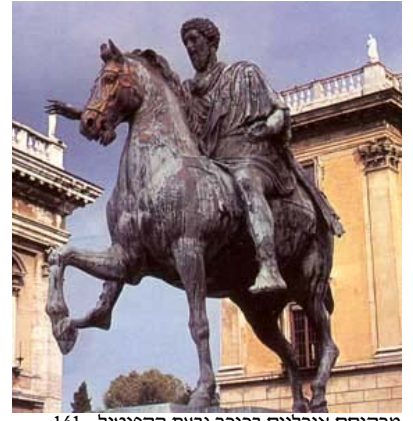
מרקוסס אורליוס בכיכר גבעת הקפיטול, 161-