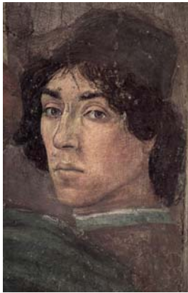
פיליפּינו ליפּי, דיוקן עצמי, פרט: "הפולמוס עם שמעון מאגוס", 1471-72, קפלה ברנקצ'י, סנטה מריה דל כרמינה, פירנצה.

את רומא, כמו את שאר איטליה, אני עתיד לבקר עוד מספר פעמים – ביקורים שהיו בהם מעט מאוד הפתעות מהסוג שאנו דנים בהם, כלומר יצירות אמנות שראיתי ופרחו מזיכרוני על אף שלימים אני עתיד להעריך כיצירות מופת. אחת הסיבות לכך היא שהמדובר, בפסלים – שממילא התעלמתי מהם לאורך כל המסע. אותו הדין לגבי בנינים; נושא שאני יכול אלא לחזור ולומר בביטחון: "לא ידעתי – לא ראיתי – לא זכרתי". באשר לנאפולי ואוצרות המוזיאון לעתיקות, שעליהם סיפרתי במכתב ששלחתי בזמנו לנורה, אלה מחכים עד היום לביקורי החוזר בין אלה פסיפס "קרב איסוס" שבו ניצח אלכסנדר מוקדון את מלך פרס, את פסל "נושא החנית" ועוד.