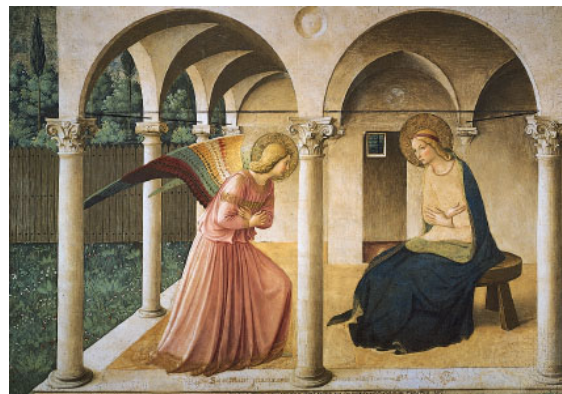
פרה אנג'ליקו, "הבשורה", 1437-46, פרסקו, מוזיאון סן מרקו, פירנצה.