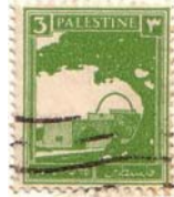
בולי המנדט הבריטי

אני מניח שגורם מסייע לתופעת "הכרתי-זכרתי" הם מאות האמנים ואלפי התמונות המוצגות במוזיאונים, העולים עם האמירה "מרוב עצים אין רואים את היער". זאת בנוסף לאפולונית ששררה בהם באותה תקופה ובמיוחד בימי החורף, כאשר נורית בודדת האירה את החדרים וגם את זו נהגו השומרים להדליק רק כאשר נכנסו לחדר ולכבות כאשר יצאנו. לעומת זאת אני יכול ליחס את אותו הגורם להתעלמות מפסלים, לא כל שכן לאלה העומדים בחוף, שראיתי וזכרתי במסעותי הבאים, לאחר שכבר ידעתי על קיומם. עם כי גם במקרה זה ניתן להאשים את מאות פסלי החוצות, רובם חסרי חשיבות, הפזורים בכל אירופה: על הגגות ובגומחות הבניינים או על כניס ברחובות ובגנים. כתוצאה משפע זה קל מאוד למי שאינו בקי בדבר להתעלם מהבודדים שהם בעלי משמעות.