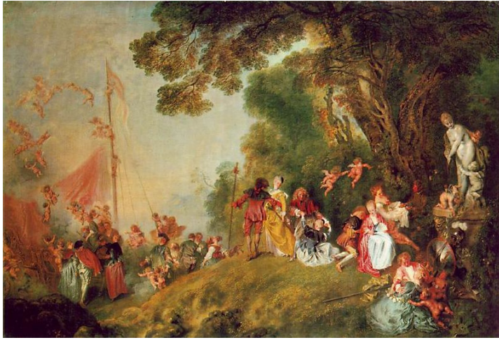
אנטואן וואטאו, "המסע לקיתרה", 1718-20, שמן על בד, 129X194, שארלוטנבורג, ברלין.